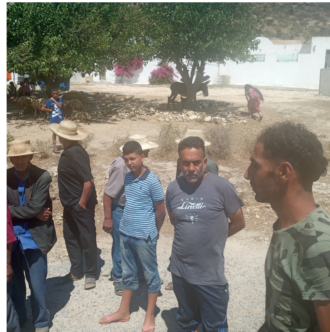
منطقة الشرفين بمنزل بوزلفة