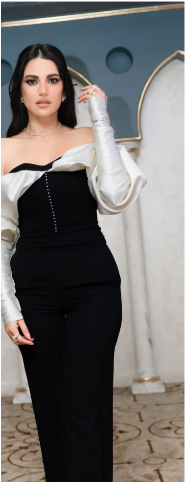
ويعد مسلسل ليالي أوجيني " آخر أعمال ظافر العابدين الرمضانية والذي قدّمه سنة 2018.