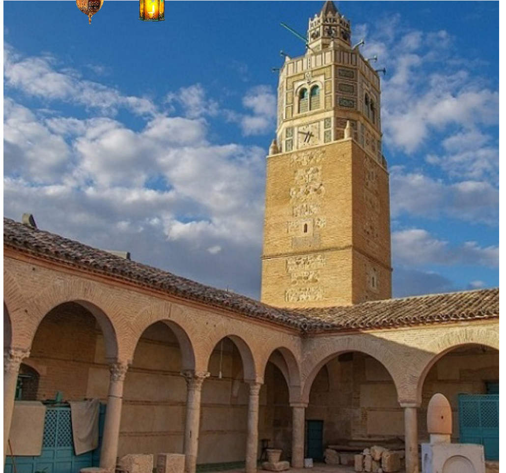
الجامع الكبير بتستور