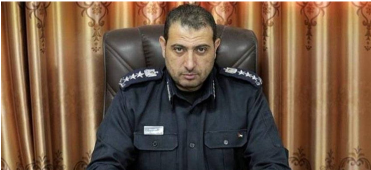
محمود بن محمود

أثار اغتيال الاحتلال الصهيوني للشهيد العميد فايق المبحوح وهو قيادي امني كبير في غزة وكان له دور كبير في إدخال المساعدات ، عديد الاسئلة عن الأسباب الحقيقية لقيام الاحتلال بهذه العملية الإرهابية .