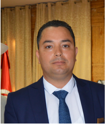
بقلم الباحث: سوار الهرايبي